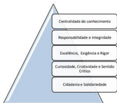
Fig.1 – Esquema dos Valores do PEAEC

À luz do Perfil dos Alunos para o Século XXI (PA), dos Valores inscritos no Projeto Educativo do Agrupamento de Escolas da Cidadela (PEAEC) e de acordo com o Programa Nacional de Educação Física (PNEF) e as Aprendizagens Essenciais (AE), genericamente, são apreciadas competências em 3 áreas fundamentais, Área das Atividades Físicas , Área da Aptidão Física e Área dos Conhecimentos que assentam numa base estrutural de Competências que são comuns a todas as áreas , desenvolvendo as competências-chave do PA e os Valores do PEAEC.